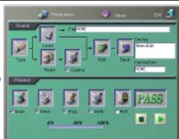
Logiciel du LEAPER-3C/3D